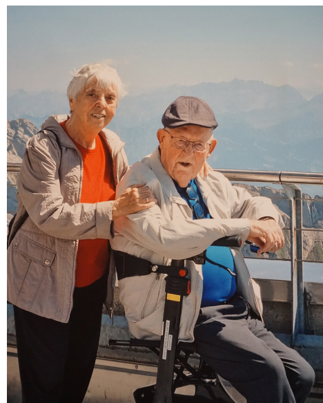
Bei unserem letzten Besuch auf dem Säntis im September 2025

wegs, meiner absoluten Lieblingsregion. Sicher 20- bis 30-mal bin ich auf den Säntis hinaufgewandert, gemeinsam mit meiner Familie oder Freunden.